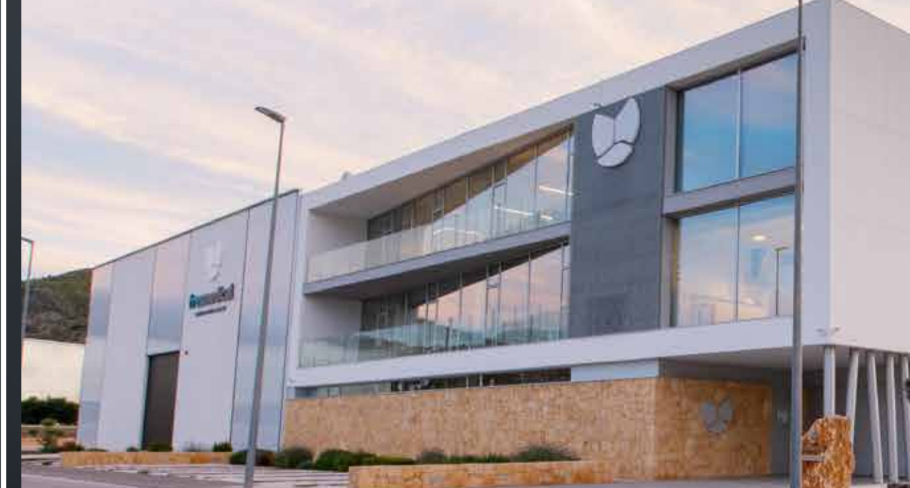
Edificio Grupo 3D Solutions.